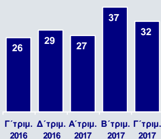
Καθαρά Κέρδη Εξωτερικού (προ εκτάκτων αποτελεσμάτων, €εκ.)

Οι δραστηριότητες στο εξωτερικό παρέμειναν σταθερά κερδοφόρες, με τα καθαρά κέρδη πριν από έκτακτα αποτελέσματα και μη συνεχιζόμενες δραστηριότητες να ανέρχονται σε €32εκ. το Γ΄ τρίμηνο και €97εκ. το εννεάμηνο 2017.